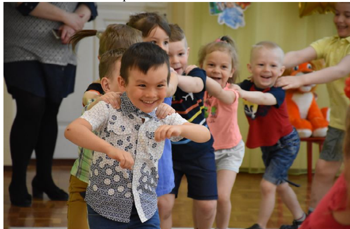
Наш корр. Анна БЕЛИНИНА

Конечно, сейчас для всех нас не легкие времена, но лишать детей праздника нельзя. Было приятно смотреть на радостные лица мальчишек и девчонок, которые излучали улыбки, и слышать залихватистый ребячий смех!