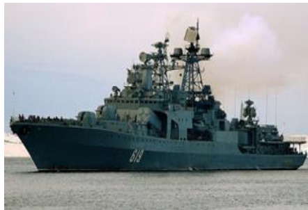
Флагман отряда кораблей «Североморск»

Посетили военные моряки и наш новоземельский архипелаг. Надо сказать, что это уже не первый заход десантных кораблей в Белушью Губу. Помнится день 3 ноября 2013 года, когда в целях военно-патриотического воспитания учащиеся нашей средней школы впервые вступили