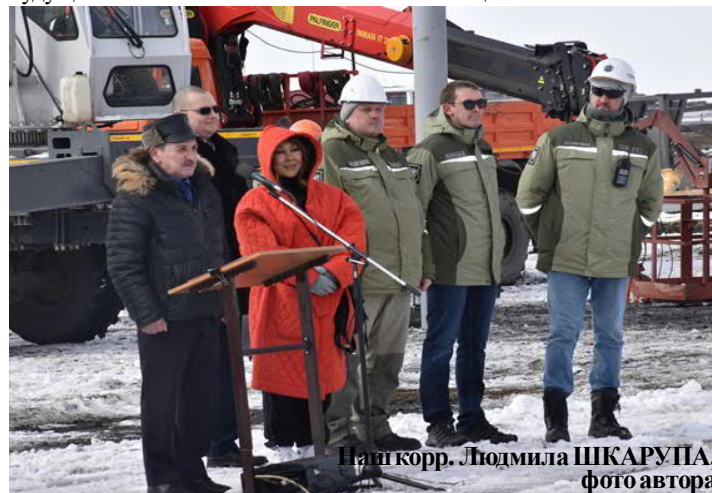
Наш корр. Людмила ШКАРУПА, фото автора

северное солнышко. Остается пожелать строителям как можно быстрее построить этот очень нужный объект, а жителям Новой Земли - светлого будущего и побольше маленьких новоземельцев!