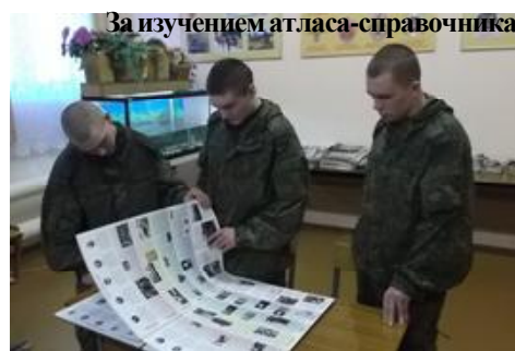
За изучением атласа-справочника

На литературном утреннике многие воины ознакомились с этими произведениями впервые, поэтому в дальнейшем запланировано проведение целого цикла литературных мероприятий, посвященных героико-патриотической тематике. Это есть своего рода работа над ошибками нашего духовно-нравственного воспитания, привития интереса к великой