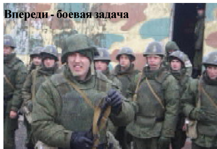
Вперед - боевая задача

командиров крайне важен для будущего Российской Армии, ведь от умелого руководства и воспитания подчиненных напрямую зависит поддержание ее боевого потенциала и уровня боевой готовности.