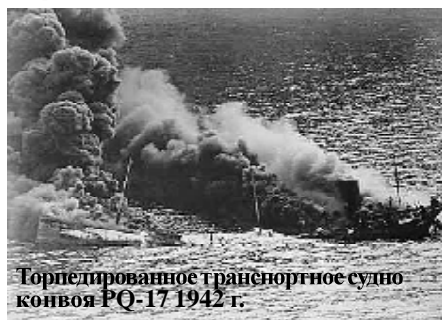
Торпедированное транспортное судно конвоя PQ-17 1942 г.

людям. Они притащили жареных уток, круто сваренные яйца и печенье, сделанное из муки и яиц. Они даже снабдили нас просоленной рыбой и черным хлебом из собственных запасов. Что еще важнее, они научили как добывать пропитание на суровом острове. Смесь и болтая, они брали нас с собой на прогулки, указывая места, где находится здоровая питьевая вода, лучшие места для