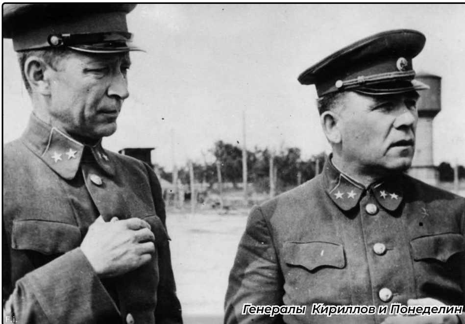
Генералы Кириллов и Понеделин

10 июля командование всеми войсками Юго-Западного направления было передано маршалу Буденному. Однако, старый герой гражданской войны, привы-