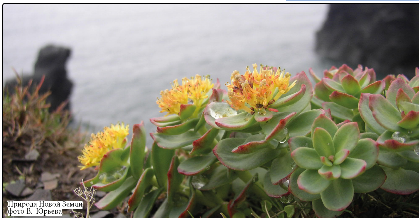
Природа Новой Земли