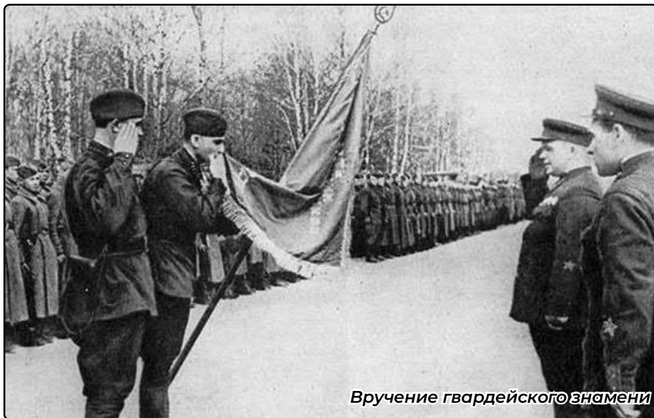
Вручение гвардейского знамени

спешке контрудар, проводимый в условиях, когда враг владел инициативой и господством в воздухе, к успеху не привел. 22-я вообще не смогла перейти в наступление. Занимая оборону силами шести дивизий в полосе шириной 280 км, она оказалась охваченной с флангов и под угрозой окружения начала отход, ведя отдельные бои в Полоцком укрепленном районе. Совершенно по-иному развивались события на левом крыле Западного фронта. Здесь 21-я армия предприняла наступление на Бобруйск с целью выхода в тыл немецкой 2-й танковой группе. 13 июля основные силы армии форсировали Днепр и за день боя продвинулись на 8-10 км. Развивая достигнутый успех, советские части отбросили врага на бобруйском направлении еще на 12 км. А действовавшая южнее 232-я стрелковая дивизия, используя лесные массивы, преодолела с боями почти 80 км и захватила переправы на реках Березина и Птичь.