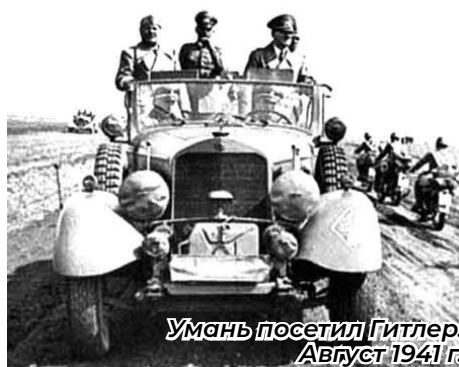
Умань посетил Гитлер. Август 1941 г.

В плен попали примерно 10 тысяч военнослужащих РККА. Погибших бойцов и командиров в зоне котла гитлеровцы обнаружили около 18,5 тыс. человек. Все взятые в плен красноармейцы и командиры РККА были помещены в концлагерь «Уманская яма», где примерно уничтожались немцами и украинскими полицейскими.