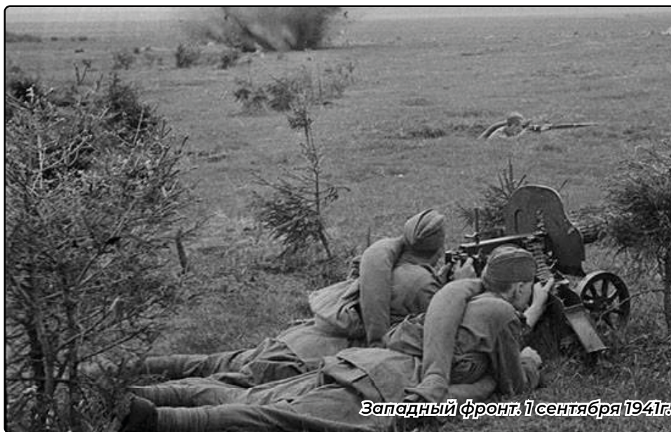
Западный фронт, 1 сентября 1941г.

О Смоленском сражении, читайте на стр. 2 - 3