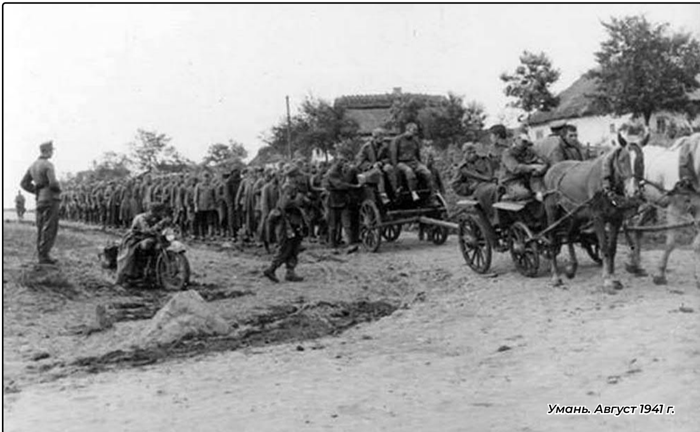
Умань. Август 1941 г.

2 августа Понеделин докладывал: «Снаряды не поступают. Осталось по два-три выстрела». Немцы же наступали, уничтожая группы разрозненных войск советских войск и сужая кольцо котла.