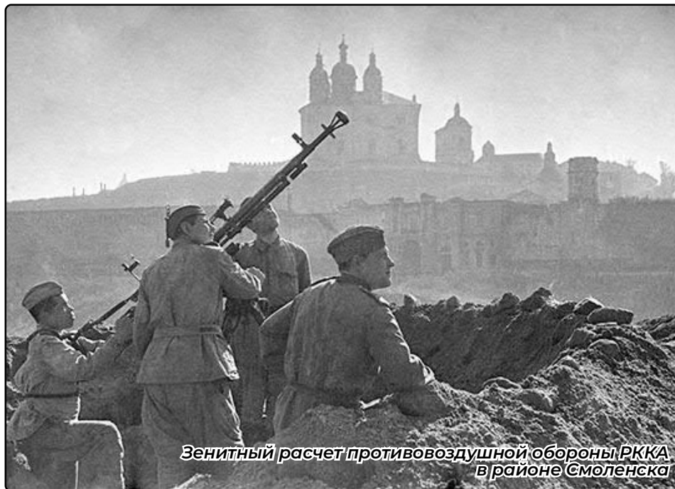
Зенитный расчет противовоздушной обороны РККА в районе Смоленска

стигли ни та, ни другая стороны. Важным этапом Смоленского сражения стала Ельнинская наступательная операция, проведенная силами 24-й армии Резервного фронта. В период с 30 августа по 8 сентября 24-я армия, входившая в Резервный фронт, который возглавил генерал армии Г.К. Жуков, разгромила