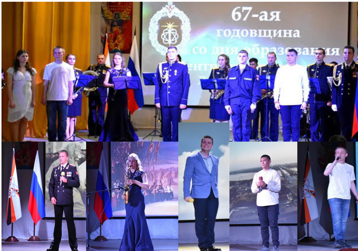
Наш корр. Лейсан САФИКАНОВА, фото Людмилы ШКАРУПЫ.

Праздник пролетел на одном дыхании и оставил после себя атмосферу радости и гордости за наших защитников страны, ведь военнослужащие нашего времени свято чтут традиции создателей ядерного щита России и продолжают успешно выполнять поставленные задачи и защищать Родину даже на краю света.