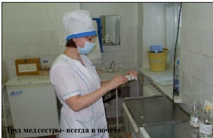
Труд медсестры - всегда в почете

Несмотря на постоянное обновление коллектива, в стенах нашего лечебного учреждения всегда сохранялся прежний дух гуманизма и человеколюбия, так свойственный представителям медицинской профессии. Об этом в гарнизоне знают не понаслышке, ведь почти каждый из нас хотя бы раз обращался в поликлиническое отделение.