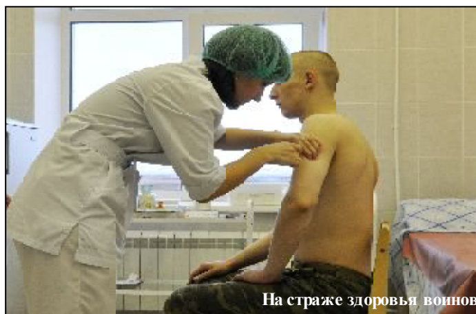
На страже здоровья воинов.

И сегодня люди в белых халатах по-прежнему