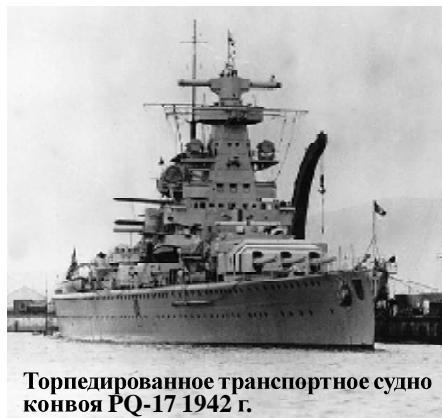
Торпедированное транспортное судно конвоя PQ-17 1942 г.

Война на море собирала дань с Новой Земли... В августе и сентябре 1943 года