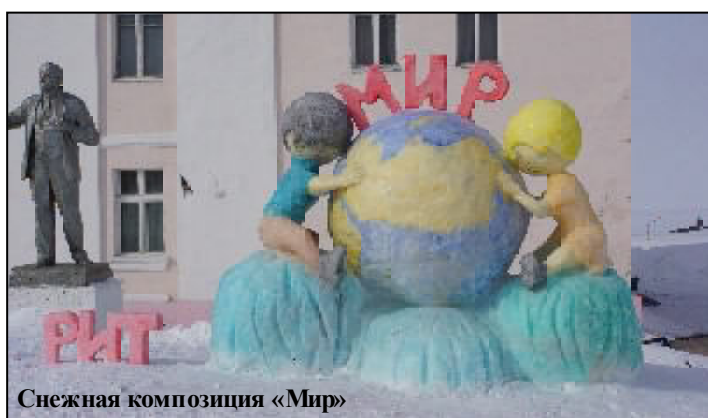
Снежная композиция «Мир»

В конце мероприятия были подведены итоги конкурса снежных композиций. Первое место заслуженно заняли военнослужащие роты инженерной техники за тематическую