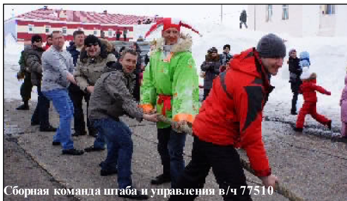
Сборная команда штаба и управления в/ч 77510

Продолжился праздник массовым народным гулянием, приуроченным к празднованию проводов зимы. Играла веселая, бодрая музыка, все гуляли, рассматривали снежные фигуры, фотографировались. Силам и гарнизонного Дома офицеров и представителей художественной самодеятельности было организовано театрализованное представление, в котором с удовольствием приняли участие и взрослые, и, особенно, дети. Были проведены традиционные конкурсы и развлечения. В напряженной борьбе в конкурсе по перетягиванию каната победила сборная команда узла связи и роты охраны. Второе место заняла команда штаба и управления войсковой части