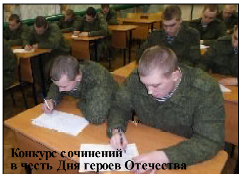
Конкурс сочинений в честь Дня героев Отечества

В подразделениях со всеми категориями военнослужащих были проведены лектории и беседы, посвященные дням воинской славы и героям Отечества. В ходе их проведения демонстрировались художественные фильмы патриотической направленности, повествующие о героических страницах нашей Родины.