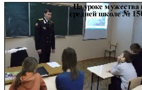
На уроке мужества в средней школе № 150

отслужил два года". В этих словах чувствуется, что преемственность традиций нашего патриотизма, и готовность достойно выполнить свой конституционный долг перед Родиной, являются также и семейными ценностями нашего общества.