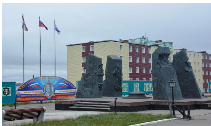
Материал подготовила Анастасия ХОХЛОВА, старший инструктор (по военно-политической подготовке и информированию) военно-политического отделения войсковой части 77510

своих предшественников продолжают и приумножают новые поколения защитников Отечества. В суровых условиях Арктики личный состав частей и подразделений успешно решает задачи стоящие перед соединением.