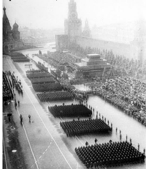
Парад Победы 24 июня 1945 года на Красной площади в Москве

тысячи человек, 1,85 тысяч единиц техники и 511 самолетов и вертолетов.