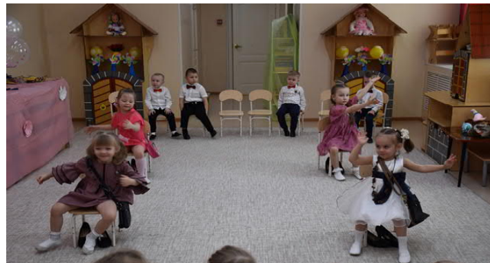
Наш корр. Людмила ШКАРУПА, фото автора и Лейсан САФИКАНОВОЙ.

Чудесные были утренники-праздники в детском саду "Умка". Молодцы!