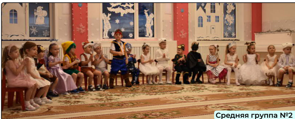
Средняя группа №2

В подготовительной группе праздник начался с романтического вальса в исполнении прекрасных дам и юных джентльменов. Затем в гости заглянул