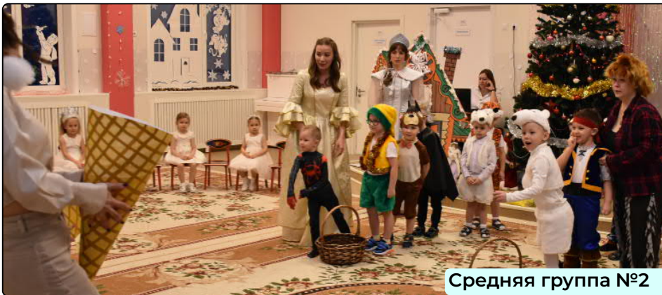
Средняя группа №2

Следующим был утренник в средней группе №2. Начался он с песенки про елочку, которую исполнили родители маленьких артистов. Услышав любимые голоса, на сцену выбежали зайчата, медвежата, тигренки, трансформер, человек-паук, бэтмен и волшебные снежинки. Рассказали стихотворения, спели про маленькую елочку, а затем к ним в гости заглянул домовенок Кузя. (продолжение на стр. 3)