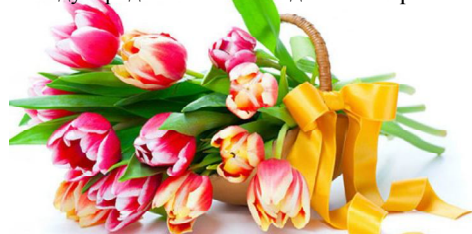
Наш корр. Игорь ДУБОНОСОВ

С праздниками милые дамы, с Международным женским днем 8 Марта!