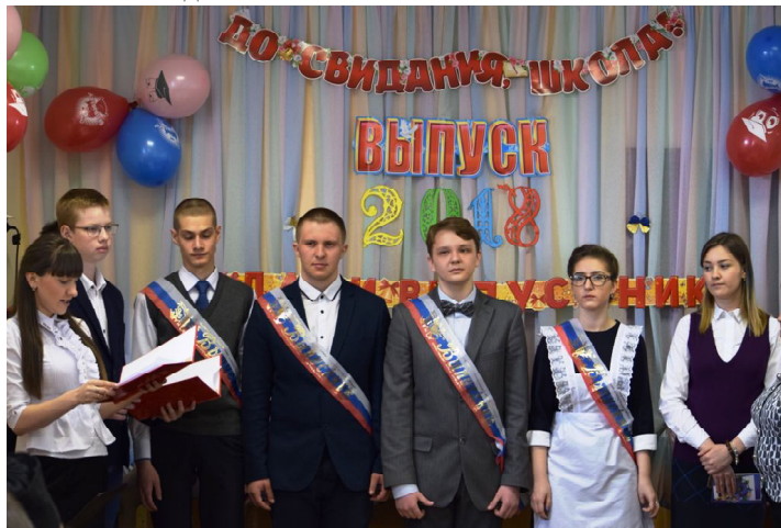
Советская форма и белые банты. Как раз из-за экзаменов