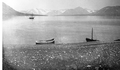
Против Маточкин Шар

В 1886 году состоялось его первое заграничное путешествие, включившее в себя посещения Палестины, Египта и Турции, а уже весной следующего года неутомимый путешественник начал подготовку к зимовке на Новой Земле. ИРГО, членом которого он являлся, поручило Носилону изучить условия жизни человека на этом архипелаге. Это была задача государственной важности, связанная с необходимостью заселения Новой Земли русскими промышленниками и предохранением ее от иностранной экспансии. Носилону предоставили возможность