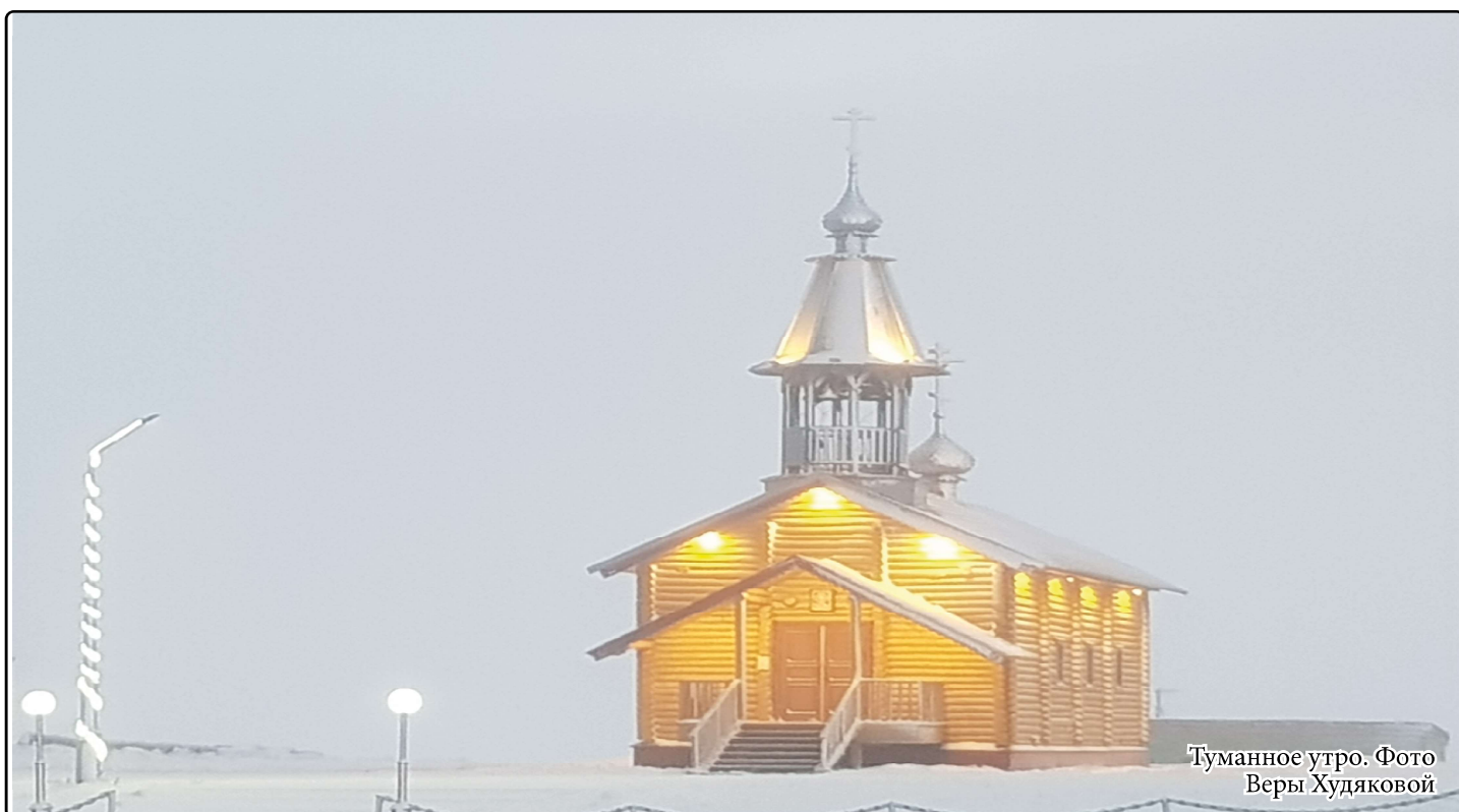
Туманное утро.