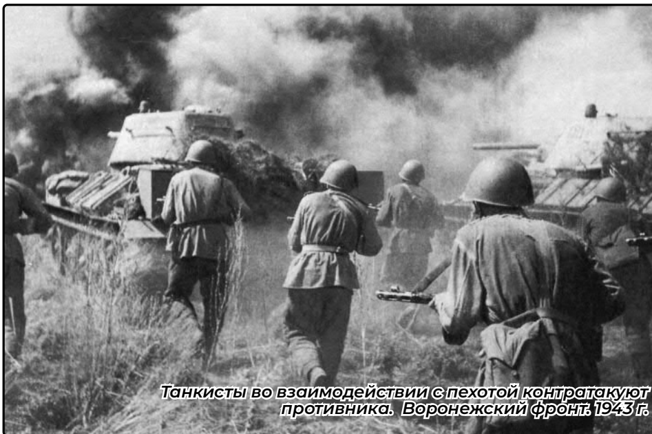
Танкисты во взаимодействии с пехотой контратакуют противника. Воронежский фронт, 1943 г.

Ставка ВГК приняла решение не переходить первыми в наступлении, а занять жесткую оборону. Замысел советского командования состоял в том, чтобы вначале обескровить силы противника, выбить его новые танки, и лишь затем, введя в