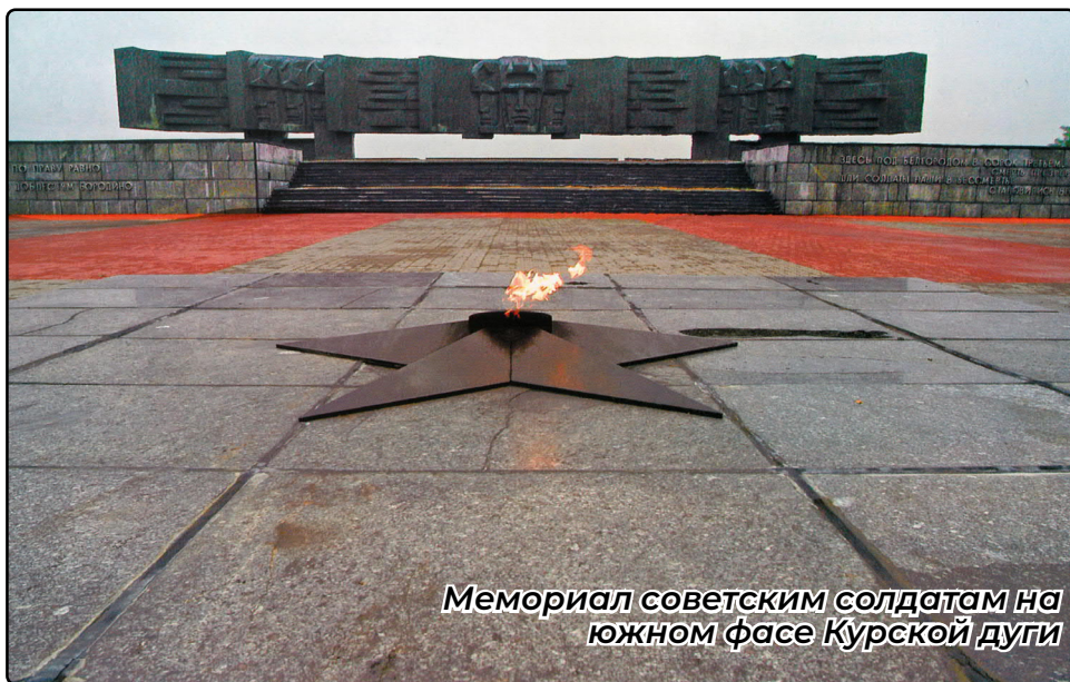
Мемориал советским солдатам на южном фесе Курской дуги