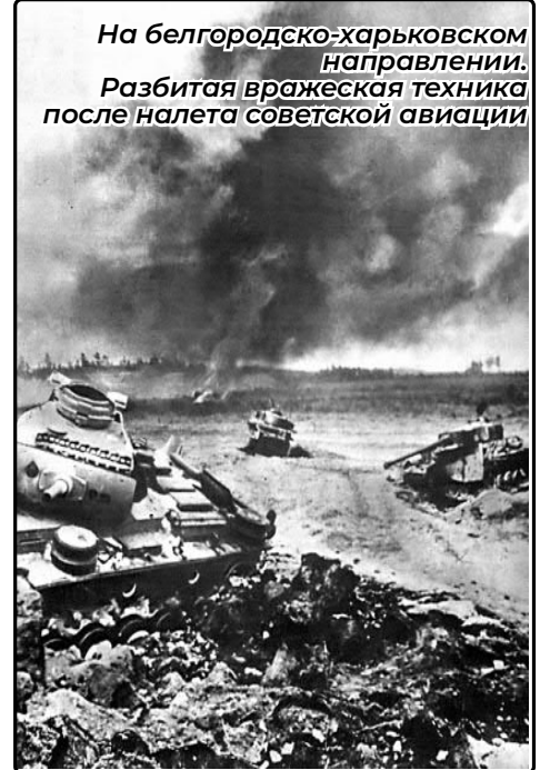
На белгородско-харьковском направлении. Разбитая вражеская техника после налета советской авиации

В итоге 17 июля 1943 г. командование сухопутных войск Германии приказало вывести из состава группы армий «Юг» 2-й танковый корпус СС. Манштейну не оставалось ничего иного, как отступить. Ход битвы. Наступление. В середине июля 1943 г. началась вторая фаза гигантской битвы под Курском. 12 – 15 июля перешли в наступление Брянский, Центральный и Западные фронты, а 3 августа, после того как войска Воронежского и Степного фронтов отбросили противника на исходные позиции на южном крыле Курского выступа, они приступили к осуществлению Белгородско-Харьковской наступательной операции (операция «Румянцев»). Бои на всех участках продолжали носить чрезвычайно сложный и ожесточенный характер. Положение осложнялось еще и тем, что в полосе наступления Воронежского и Степного фронтов (на юге), а также в полосе Центрального фронта (на севере) главные удары наших войск наносились не по слабому, а по сильному участку вражеской обороны. Такое решение было принято для того, чтобы максимально сократить сроки подготовки к наступательным